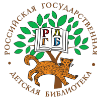
Российская государственная детская библиотека